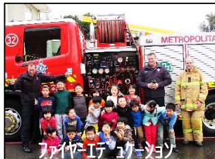
ファイアエンジン