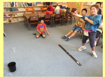
たのしい思い出がたくさん